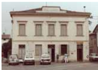
L'ex sede municipale