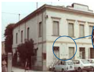
Le lapidi storiche affisse nella vecchia sedemunicipale

con i nomi dei caduti di Onara e di Tombolo e da UNA STATUA.