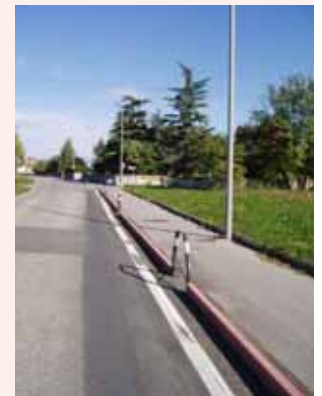
...La pista ciclabile dopo la sistemazione