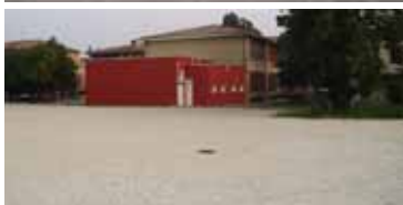
Il parcheggio di Via Fermi e quello dietro le Scuole Elementari di Tombolo

L'Amministrazione Comunale si è impegnata subito dall'inizio al fine di acquisire tre nuove aree a parcheggio, una dietro le Scuole elementari di Tombolo, un'altra in Via Fermi ed in Via Einaudi, già realizzate, ed un'altra, di prossima realizzazione, in Via Vittorio Veneto, in adiacenza al Municipio, all'interno del progetto di riqualificazione dell'area EX-SART, dove verrà creata la Nuova Piazza Municipio di circa 3000 metri quadrati.