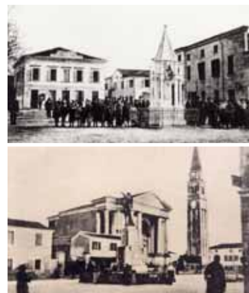
Alcune foto storiche del Centro di Tombolo

Le ricerche storiche hanno fatto emergere molte "verità" finora più o meno sconosciute. E' impossibile in quest'articolo approfondirle tutte, in quanto non basterebbero vari numeri del Giornale Comunale anche solo per elencarle. Come anticipato si provvederà a fornire una pubblicazione dedicata. La prima precisazione molto importante da sottolineare riguarda proprio il tema generico "Monumento". Questo termine infatti viene normalmente, erroneamente, associato al termine "statua". In alcuni casi è pur vero, che un Monumento può essere costituito esclusivamente da una statua e dal suo "pedistallo". In molti altri casi, invece, il Monumento può essere costituito da più elementi, da varie statue, da svariate simbologie, comunque finalizzate a costituire un unico elemento anche senza continuità fisica. In quest'ultimo caso rientra il "Monumento ai Caduti di Tombolo" voluto e pensato dai nostri Padri per essere costituito da più elementi e con vari significati simbolici. Iniziamo con il dire che il Monumento ai Caduti di Tombolo era costituito da DUE GRANDI LAPIDI