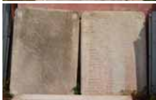
Le lapidi ritrovate dall'attuale Amministrazione comunale