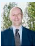
Giancarlo Lago Assessore alla Cultura e Istruzione