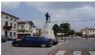
l'attuale sistemazione del centro di Tombolo

E' in dirittura di arrivo il progetto esecutivo di riqualificazione di Piazza PIO X dopo anni di intenso studio e progettazione. Il lungo cammino, partito il 03 Giugno 2005 con il Concorso di Progettazione indetto dal Comune di Tombolo ha impegnato strenuamente una settantina di progettisti, una qualificata giuria, la Sovrintendenza ai Beni Architettonici e Monumentali del Veneto, vari Uffici ed Enti Superiori e l'Amministrazione Comunale.