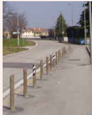
La pista ciclabile prima...