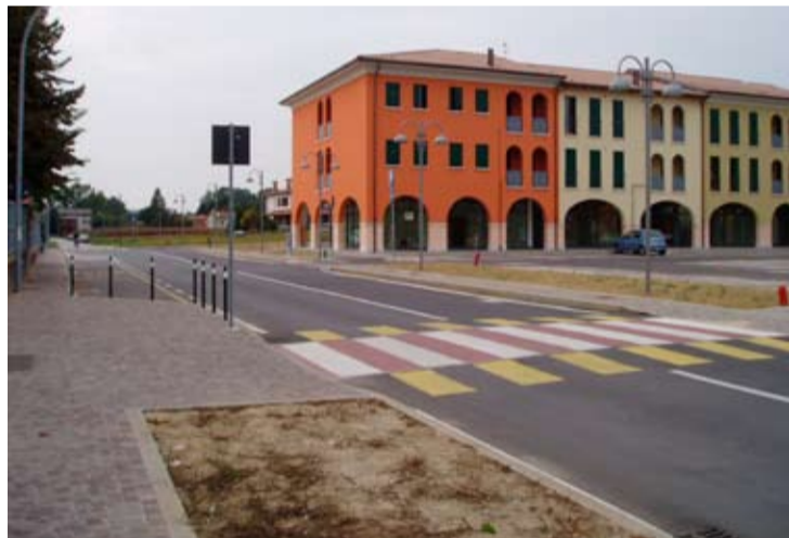
Via Asilo in prossimità dell'incrocio con la Provinciale

www.comune.tombolo.pd.it oppure in municipio.