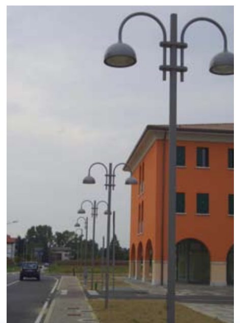
Via Asilo - particolare dell'illuminazione

L'Amministrazione comunale ha inoltre acquisito la proprietà di tutte le adiacenti aree verdi, la cui manutenzione sarà a carico del comune stesso e che verranno presto valorizzate con piante, fiori e tappeto verde, similmente a quanto è già avvenuto nelle fioriere della piazza. Le aree a verde verranno dotate anch'esse di sistema di irrigazione temporizzata. Tutti questi lavori e quelli che seguiranno nel prossimo futuro sono propedeutici alla futura realizzazione della Piazza di Onara che è in programma per i prossimi anni, capace di accogliere nuovi negozi e capace di creare le condizioni di una maggiore aggregazione sociale.