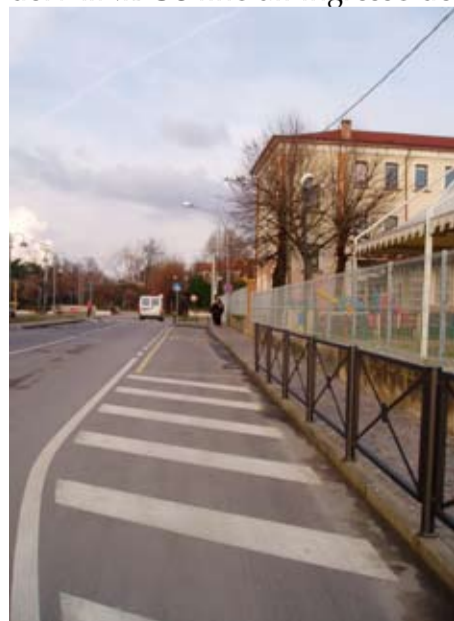
Via Asilo - particolare del marciapiede e della recinzione

lottizzazione, come quella dinanzi a Villa Giusti (la famosa C2-44) fosse già stata convenzionata dalla precedente Amministrazione Comunale. Su richiesta dell'attuale Amministrazione Comunale il proprietario si è reso disponibile a rivedere l'originario progetto di viabilità, con delle modifiche che hanno portato i seguenti risultati: essendo l'area interessata dall'accesso alle Scuole Elementari, l'Amministrazione ha proposto e ottenuto la realizzazione di un parcheggio bus ed una corsia preferenziale aggiuntiva appositamente dedicata agli scolari, nonché una zona di raccolta dei pedoni dinanzi all'ingresso laterale della scuola materna parrocchiale. Oltre a questo, il marciapiede realizzato in porfido, che porta dalla zona di sosta del MINIBUS fino all'ingresso della scuola elementare, da poche settimane è