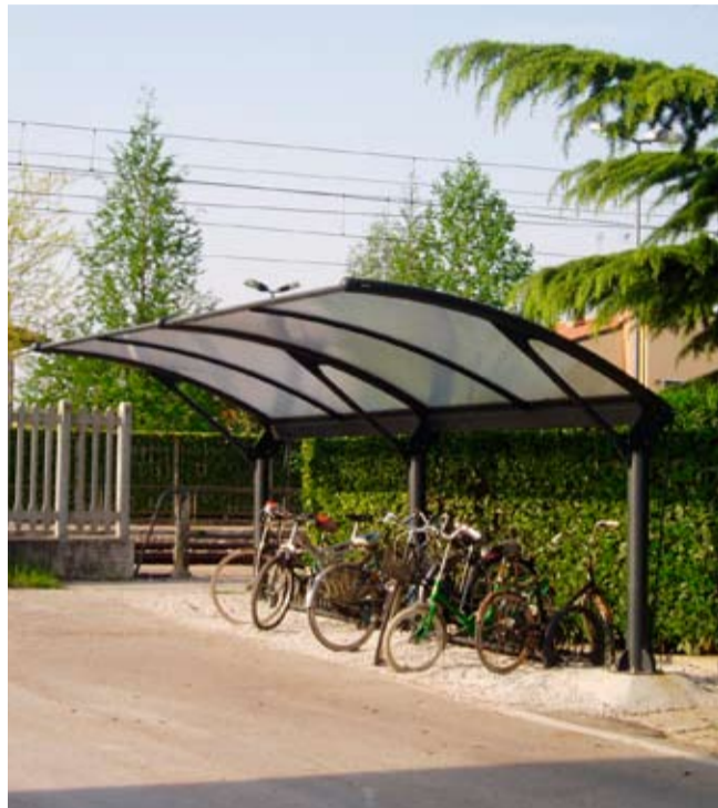
Le nuove pensiline presso la stazione ferroviaria

Continuano a ritmo incessante gli interventi tesi a restituire prestigio e decoro al nostro territorio comunale. Non passa giorno che non vengano predisposti e realizzati NUOVI interventi. Il lavoro da fare è tanto, ci sono 20 anni di ritardi ed inefficienze da recuperare, ma siamo certi che continuando di questo passo i risultati saranno sempre più visibili.