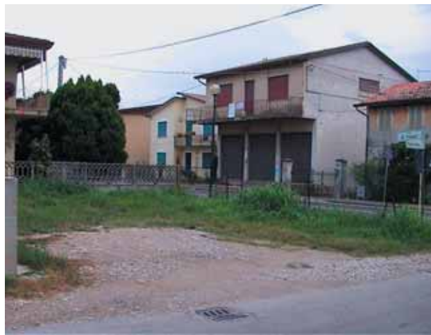
Prima del Cambiamento...