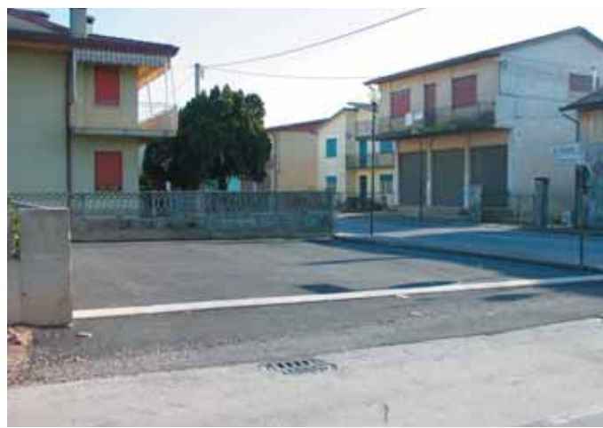
...E dopo il Cambiamento